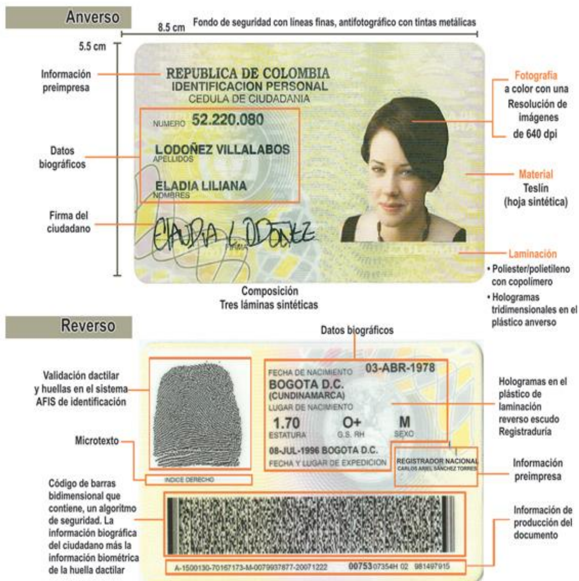
Ilustración 9. Cuarta Cedula en Colombia, Cedula amarilla.