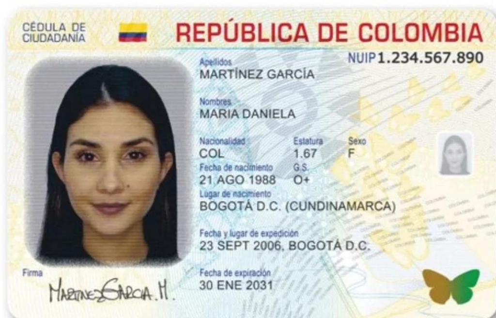
Ilustración 10. Cedula digital.

En el año 2020, la Registraduría Nacional del Estado Civil (2020) emite directivas para la expedición de la cedula digital en Colombia, donde consolida que a partir del 1 de diciembre de ese año, ya se puede empezar a la migración ante el registrador, por medio de esta cedula de ciudadanía, la registraduría destaca que según las nuevas tecnologías, con el fin de realizar de manera rápida, ágil, confiable que se respeten los datos y la seguridad, con el fin de ser consonante con el gobierno en línea y los tramites digitales, esto debido al plan de desarrollo y políticas públicas, para hacer más accesibles los servicios ante el Estado, adicionalmente, desde el 2022, este cambio será de tipo opcional y se espera que en 2022, sea de carácter obligatorio.