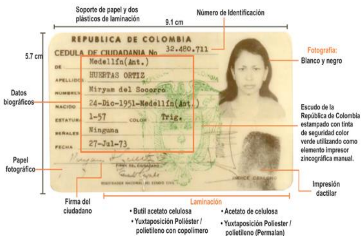
Ilustración 7. Segunda Cedula en Colombia.