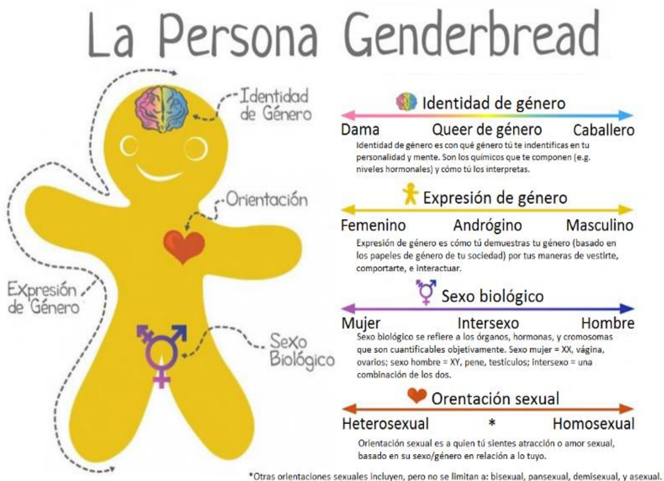
Ilustración 4. La persona Genderbread.