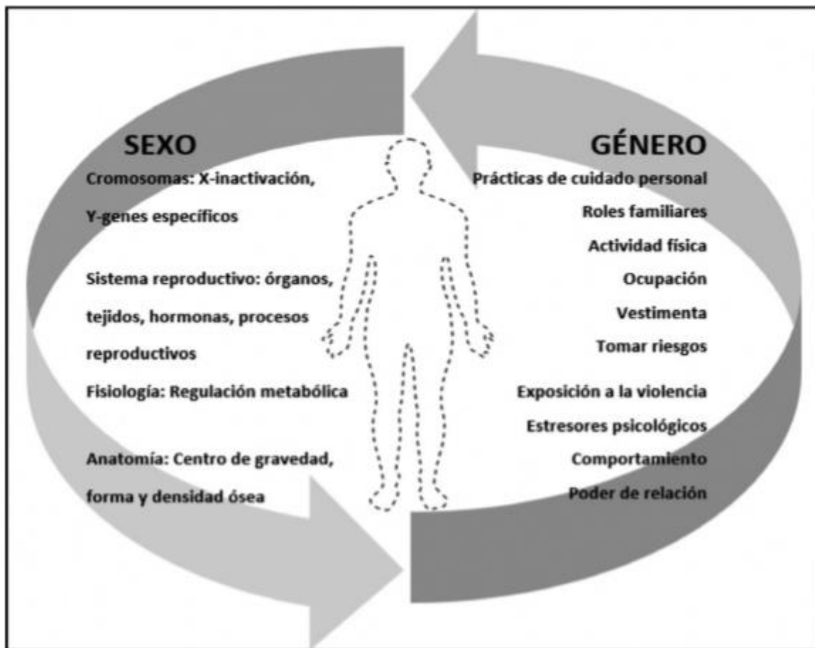
Ilustración 3. Distinción entre sexo y género.