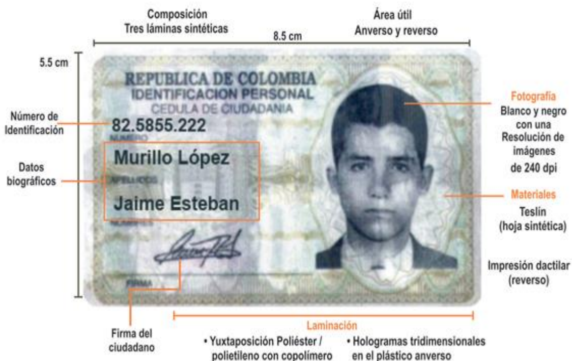
Ilustración 8. Tercera Cedula en Colombia.