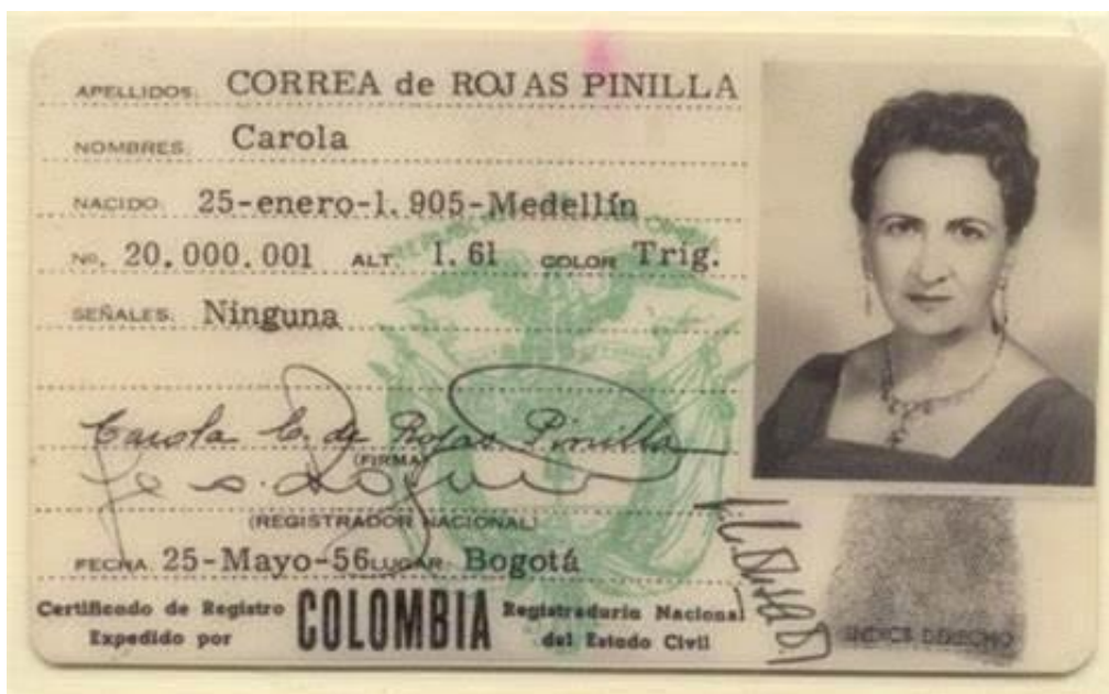
Ilustración 6. Primer cedula femenina en Colombia.