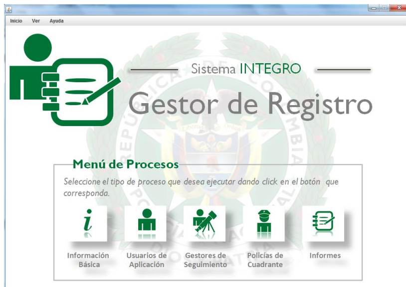
Imagen 4: Menú del Gestor de Registro

Los menús son aquellas interfaces que me permiten desplazarme para llegar a un proceso requerido con tan solo dar click en un botón. A continuación algunos ejemplos de menús: