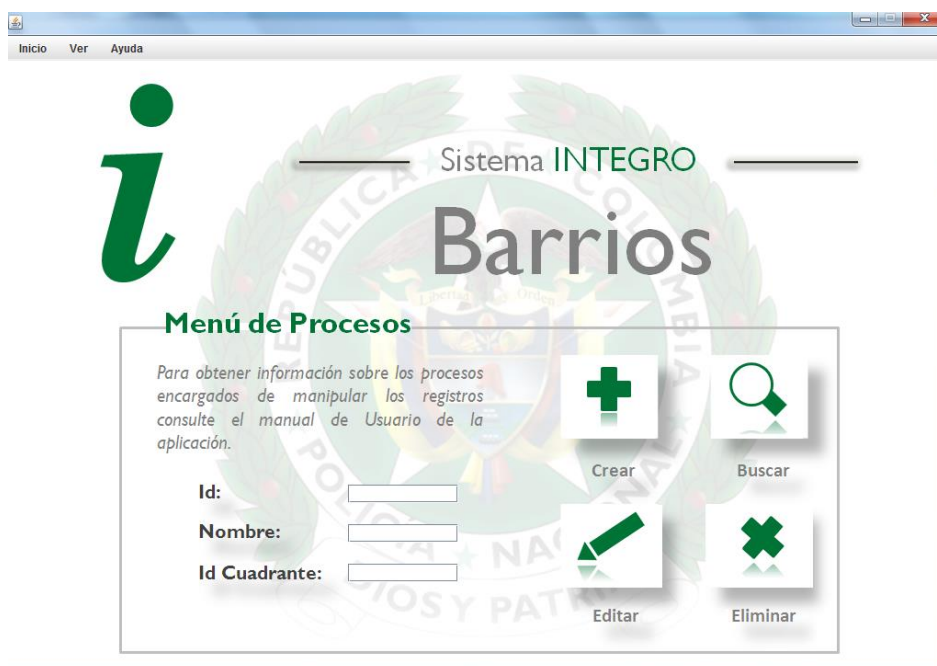
Imagen 7: Formulario de Edición de Barrios