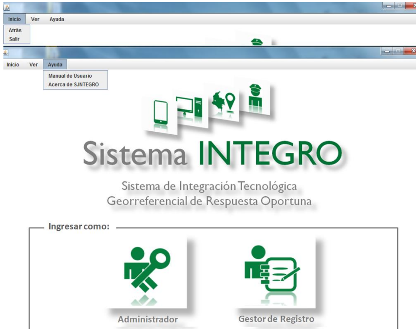
Imagen 1: Barra Superior e Interfaz Principal