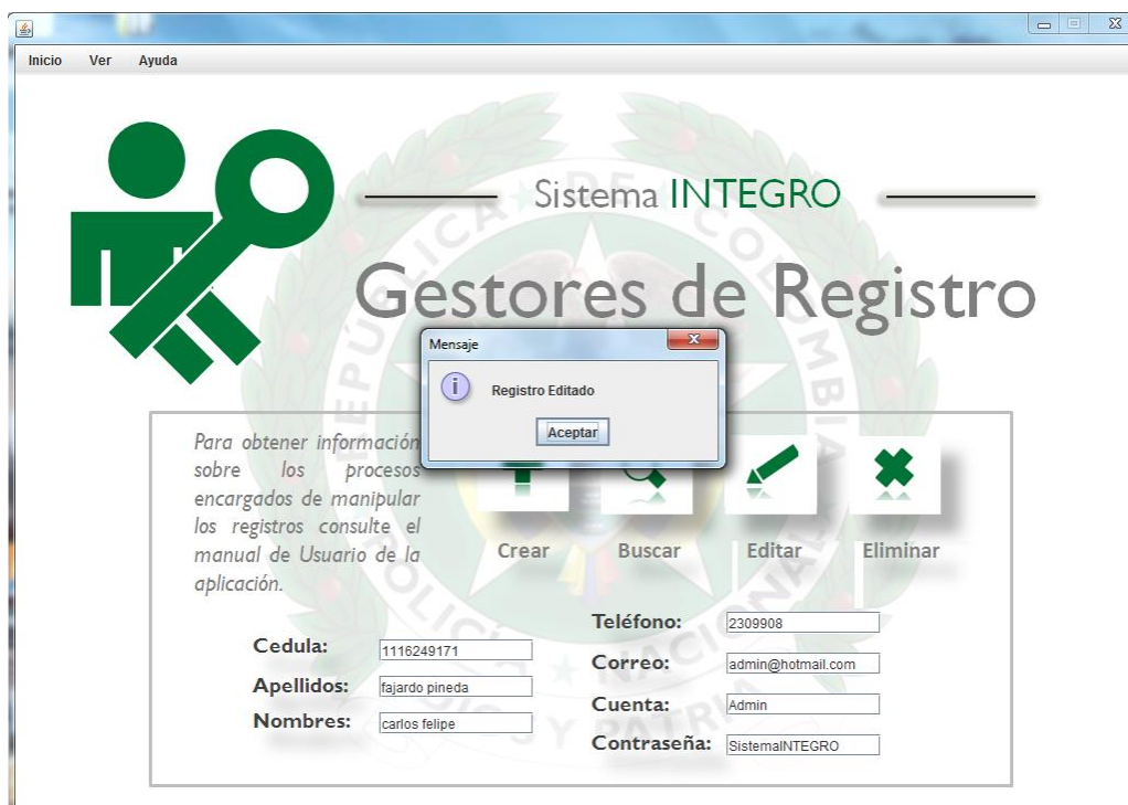
Imagen 8: Gestor de Seguimiento siendo editado