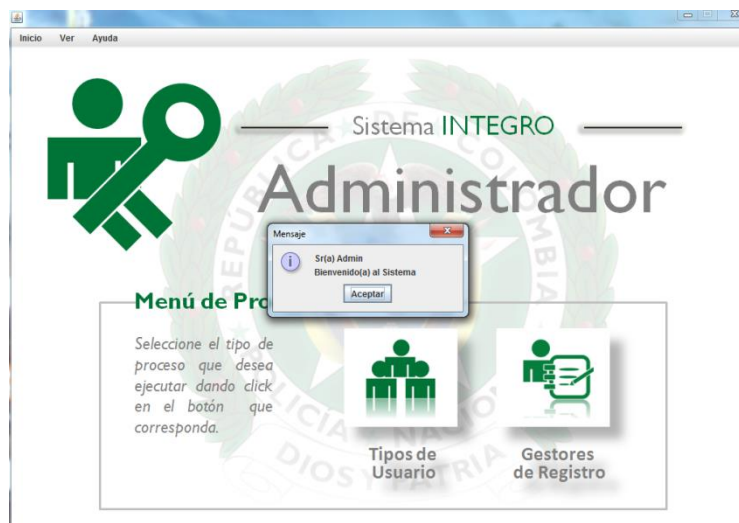
Imagen 5: Menú de procesos del Administrador