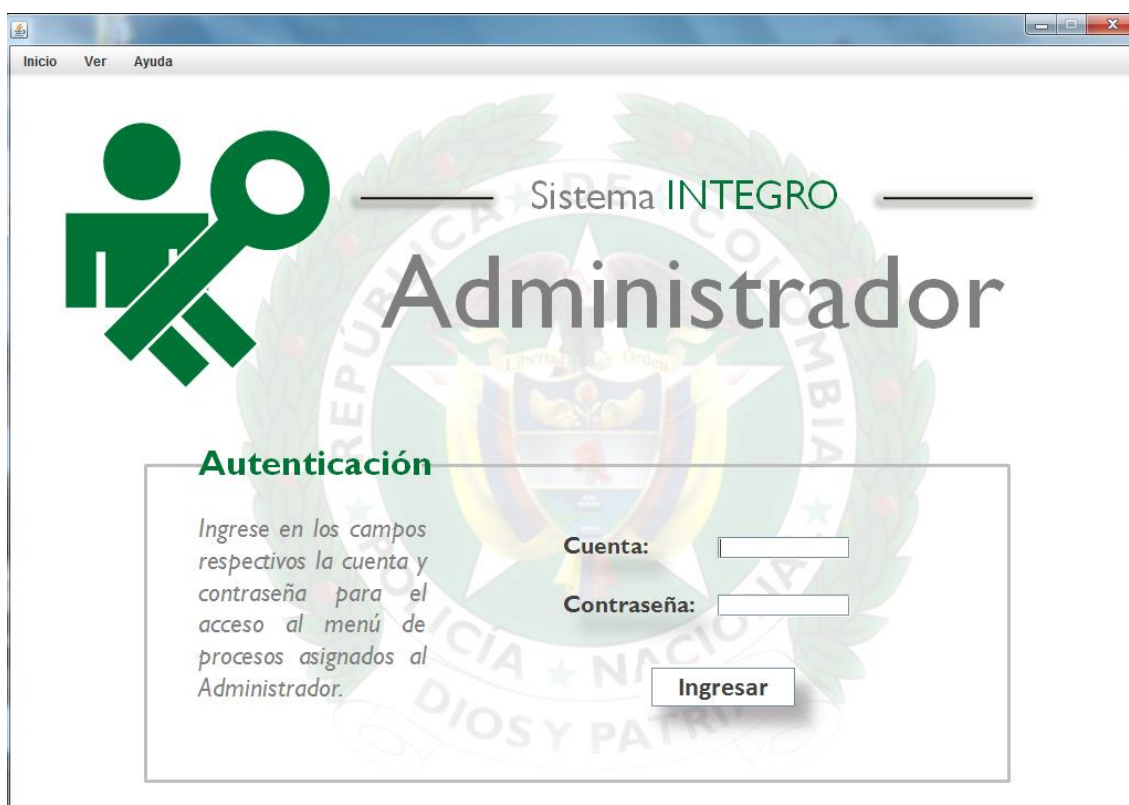
Imagen 3: Autenticación de Administrador

La siguiente es una imagen del formato de autenticación que será utilizado para los demás tipos de usuarios.