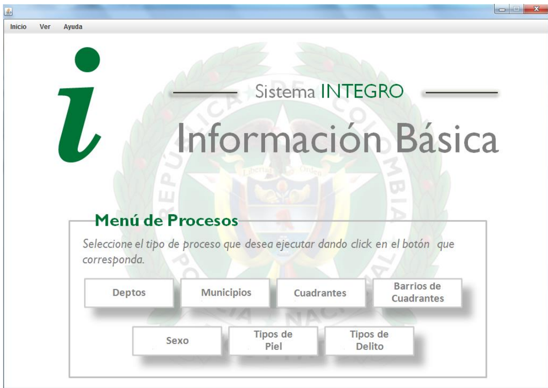
Imagen 6: Menú de Procesos de Información Básica