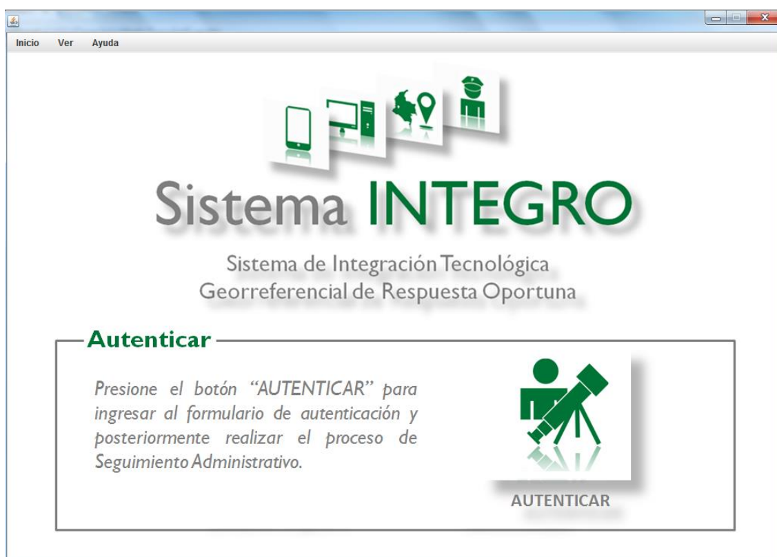
Imagen 1: Interfaz Principal

El Gestor de Seguimiento tiene su propia interfaz principal con una barra superior para realizar las tareas y desplazamientos respectivos.