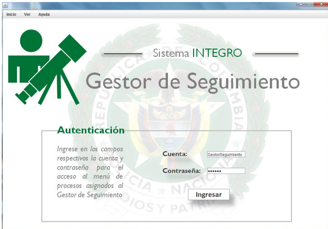
Imagen 2: Autenticación

Al igual que el resto de aplicaciones por seguridad será necesario realizar un proceso de validación para poder acceder a los privilegios de este rol.